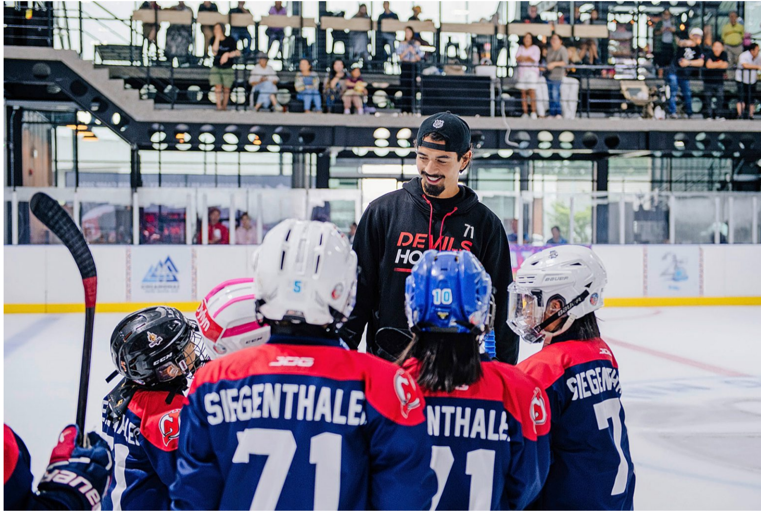
Jonas Siegenthaler mit den thailändischen Kindern: Alle tragen ein Shirt mit seinem Namen.

«Ich bin halt der erste NHL-Spieler mit Thai-Wurzeln», sagt der 27-Jährige. «Darauf sind sie recht stolz hier. Sie verfolgen, was in Amerika passiert.» Ausserhalb der Eishalle kenne man ihn in Thailand aber nicht, schiebt er nach. «Da falle ich einfach auf, weil ich so gross bin und thailändisch aussehe.»